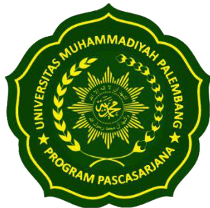
Logo PPs Berwarna Hijau

Ada 5 logo yang terdapat di PPs Universitas Muhammadiyah Palembang yaitu: logo PPs, logo Prodi Hukum, logo Prodi Manajemen, logo Prodi Pendidikan Biologi, dan logo Prodi Teknik Kimia. Perhatikan gambar berikut ini.