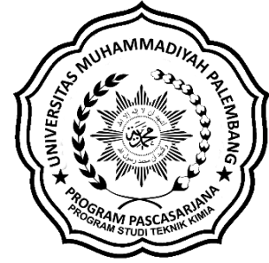
Logo Prodi Teknik Kimia Berwarna Hitam Putih