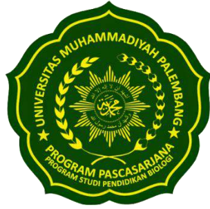
Logo Prodi Pend. Biologi Berwarna Hijau