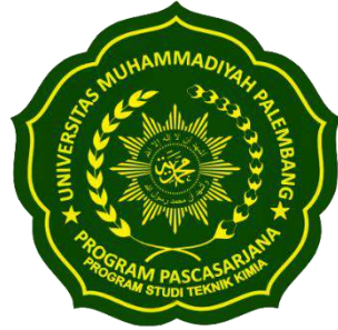
Logo Prodi Teknik Kimia Berwarna Hijau