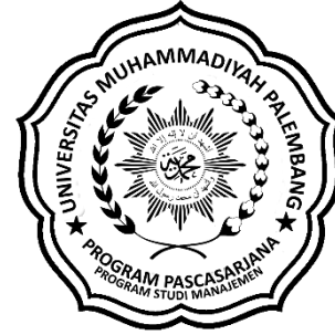
Logo Prodi Manajemen Berwarna Hitam Putih