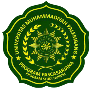
Logo Prodi Hukum Berwarna Hijau