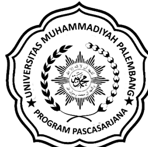
Logo PPs Berwarna Hitam Putih