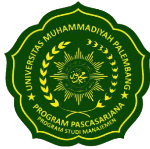
Logo Prodi Manajemen Berwarna Hijau