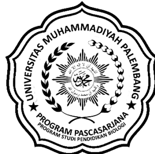
Logo Prodi Pend. Biologi Berwarna Hitam Putih