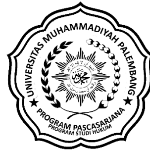
Logo Prodi Hukum Berwarna Hitam Putih